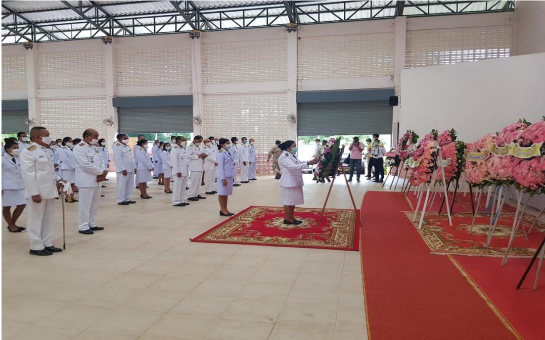
กิจกรรมเนื่องในวันคล้ายวันพระบรมราชสมภพ พระบาทสมเด็จพระบรมชนกาธิเบศร มหาภูมิพล อดุลยเดชมหาราช บรมนาถบพิตร วันชาติ และวันพ่อแห่งชาติ ๕